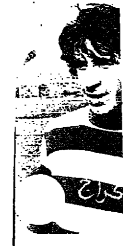
هي ارميلي منتخب الجليل ، وله د من الاهداف حيث من اصابت وكان كاتين ي اسلم الكاس لفوز ليل على فريق هوبويل د الكروم .

د الكروم ونسرق في تحي ذكرى المرحوم منذ ساعات الصباح . فرق الجليل الغربي روم لتحيي مع اهالي ذكرى المرحوم احمد صعب ومخرب فريق الكروم . مقدمة مستقبلي